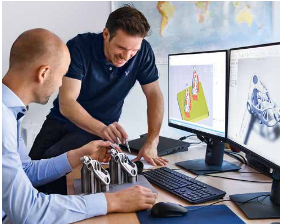
Vom 3D-Modell zum gedruckten Bauteil aus dem voestalpine Additive Manufacturing Center.

Beim sogenannten Laserstrahlschmelzen werden auf Basis von dreidimensionalen Konstruktionsdaten Bauteile Schicht für Schicht aus Metallpulver aufgebaut. Ausgangsmaterialien sind beispielsweise metallische Werkstoffe wie Stahl, Titan oder Aluminiumlegierungen – alles in Pulverform, feiner als Mehl. Beim selektiven Strahlschmelzen, zu dem auch das Laserschmelzen zählt, erzeugt ein Laser oder Elektronenstrahl die nötige Energiemenge und schmilzt auf der Oberfläche eines Pulverbettes die Kontur des Bauteils. Das Material erstarrt und bildet eine feste Schicht. Anschliessend senkt sich die Grundplatte um eine Schichtdicke ab und es wird erneut Pulver aufgetragen. Dies wiederholt sich so lange, bis das Teil vollständig aufgebaut ist. Das überschüssige Pulver wird gesiebt und wiederverwendet. Während in der Metallverarbeitung beim klassischen Drehen und Fräsen aus einem Block Material bis zur finalen Geometrie abgetragen wird, verarbeitet der 3D-Drucker nur das tatsächlich benötigte Material. Das macht das Verfahren sowohl wirtschaftlich als auch ökologisch interessant. Es wird gleichzeitig Zusatznutzen geschaffen, denn die Bauteile können flexibel und individualisiert produziert werden.