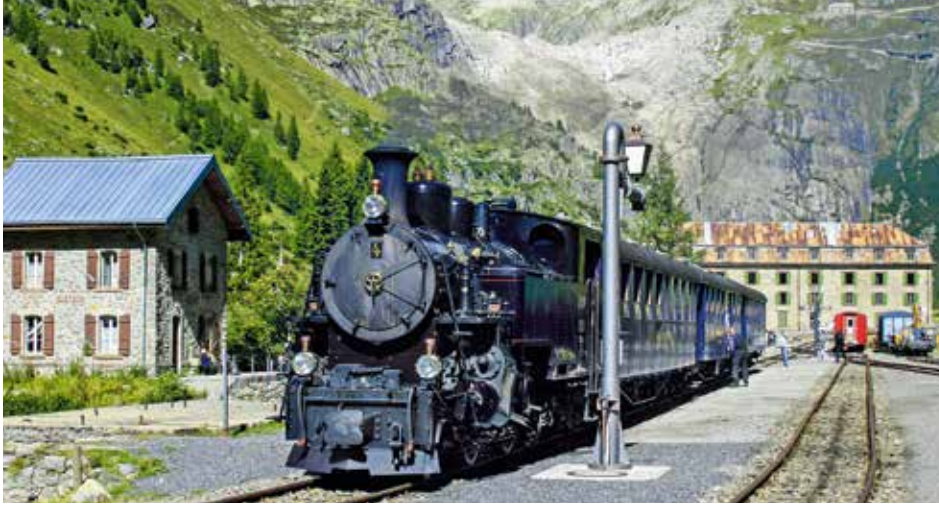
Zug der Dampfbahn Furka-Bergstrecke im Bahnhof Gletsch (VS).

Von der Begeisterung der Restaurateure angesteckt sucht man bei Böhler-Uddeholm nach einer Lösung. «Der gute und unkomplizierte Kontakt zu den Schweizer Härtereien macht vieles möglich», gibt Dominik Rzehak schmunzelnd zu bedenken.