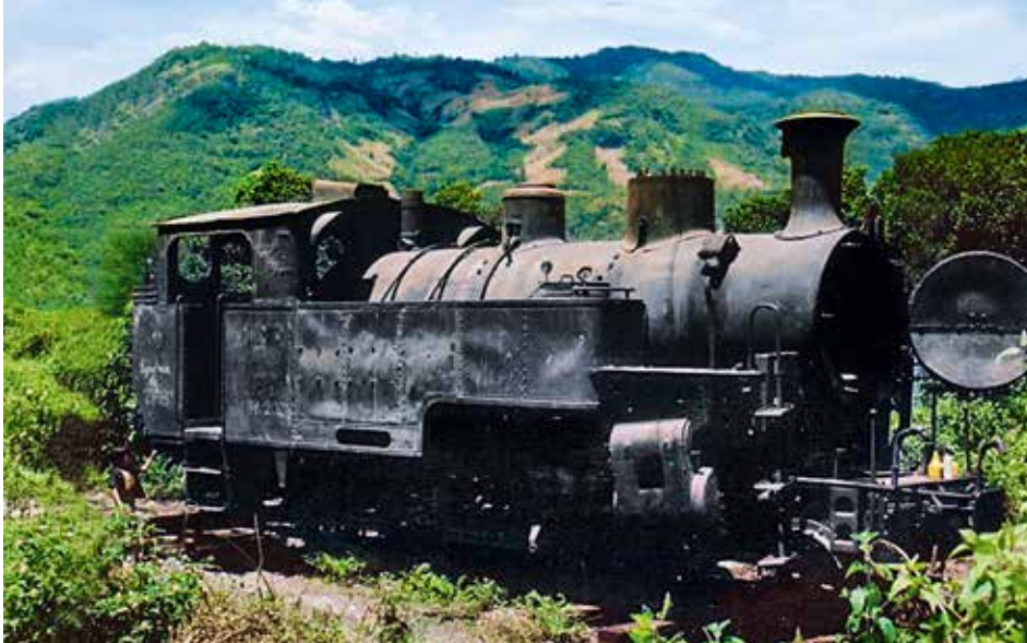
Die HG 3/4 Nr. 2 der ehemaligen Furka-Oberalp-Bahn in Song Pha, Vietnam. Diese Lokomotive wurde 1947 als Occasion nach Vietnam geliefert, und 1990 in die Schweiz zurückgeführt und diente als Ersatzteillieferer.

Seit dem 12. August 2010 fahren Nostalgiezüge, gezogen von Dampflokomotiven, auf der historischen Furka-Bergstrecke von Realp nach Oberwald am Rhonegletscher vorbei. Der Erhalt und der Betrieb dieser einmaligen Bahnstrecke wird von engagierten und fachlich kompetenten Eisenbahnfreunden in unzähligen freiwilligen Arbeitsstunden sichergestellt.